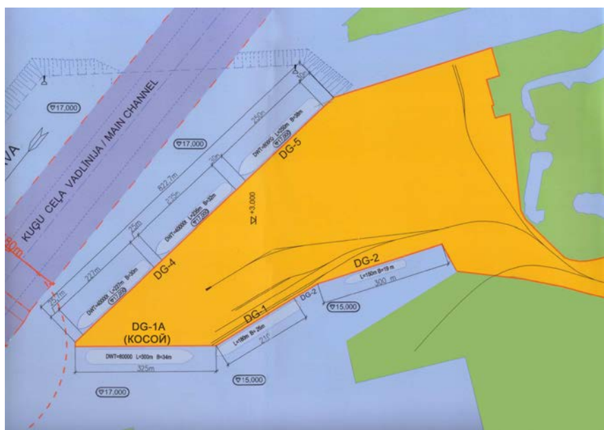
Схема 1. Перспективный план развития и схема расположения причалов.

Норма обработки угольных судов: договорная 10 000 тонн/сутки; фактическая в 2009-2010 годах 15 000-17 000 тонн/сутки.